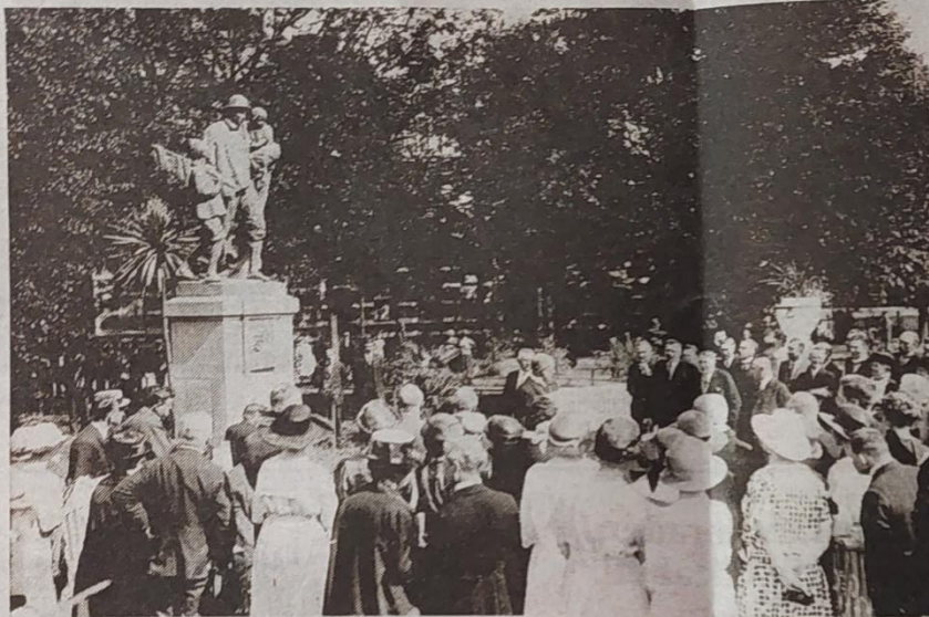
Het beeld ter ere van Jozef Israëls werd in 1922 onder grote belangstelling gepresenteerd. Rechts het beeld nu op een doordeweekse dag.

Hij werd in 1824 in Groningen geboren en bracht zijn kinder- en jongensjaren door in de stad. Hij ontdekte er zijn talent voor het schilderen. Hij kreeg les van verschillende leermeesters. Als tiener verliet hij Groningen, om zich te vestigen in Amsterdam. In de decennia die volgden, woonde en werkte hij ook in Parijs en Den Haag en ontwikkelde hij zich tot een groot en ook in het bui-