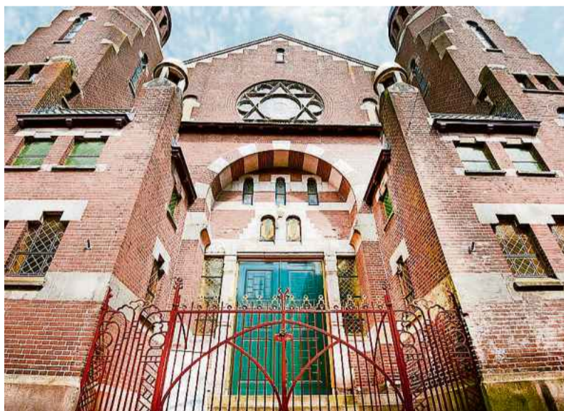
De synagoge in Groningen is een eigenzinnig gebouw, in vergelijking met de rest van Groningen.

H et valt op en maakt nieuwsgierig. Een jonge vrouw die exposities bedenkt, de collectie beheert en cultuur en erfgoed bewaakt in de Groningse synagoge. Een 'oud en stoffig instituut', met het imago van een 'mannenbolwerk'.