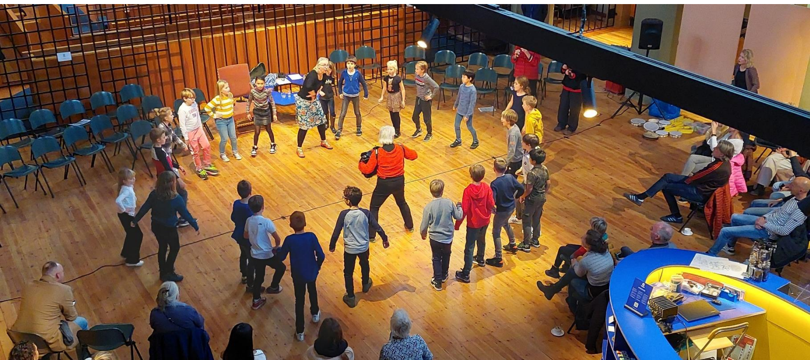
Speciaal voor groep 5/6 ontwikkelde Synagoge Groningen het muziekeducatieprogramma Klezmerklas.

In de voorgaande beleidsperiode hebben we onze presentatie (expositie) en ons programma geprofessionaliseerd. Blijkens de reacties van onze bezoekers wordt dit hoog gewaardeerd, waardoor we een stijgend aantal deelnemers aan onze programmering zien. De huidige aanstelling van onze medewerker educatie & participatie op basis van 0.2 fte is om die reden ontoereikend, zowel vanwege de vergrote vraag vanuit de maatschappij alsmede vanuit het oogpunt van goed werkgeverschap. Conform de opvattingen van de Code Good Governance en Fair Practice Code is een fulltime aanstelling voor de medewerker educatie & participatie noodzakelijk.