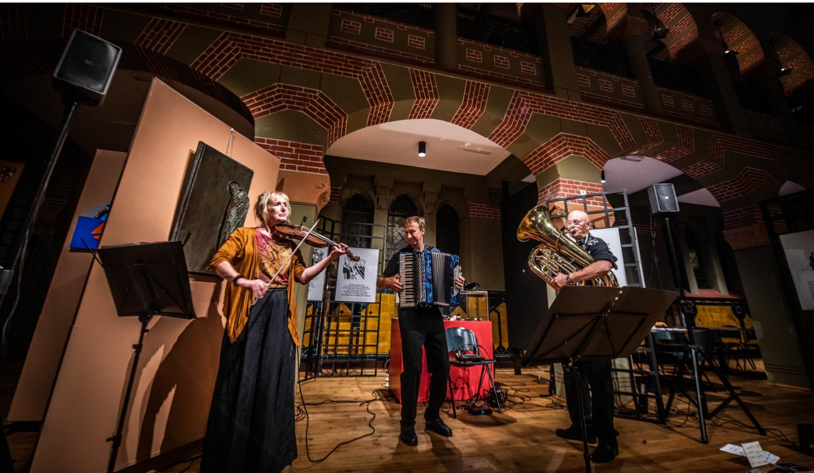
De Groningerse band Klezmer&Co. in actie tijdens de Groninger Museumnacht 2022.

Synagoge Groningen is er voor iedereen. We geven daarmee invulling aan de beleidsstrategie Samenleven met cultuur , zoals verwoord in de Kadernota Cultuur van de Gemeente Groningen en het Beleidskader Cultuur van de Provincie Groningen. We geven met onze programmering een antwoord op vraagstukken en behoeftes in onze maatschappij. Ons uitgangspunt is dat iedereen er toe doet en toegang moet hebben tot ons kunst- en culturaanbod. In onze programmering leggen we verbindingen tussen culturen, levensbeschouwingen, tijdsperiodes: verbindingen tussen mensen. Dit doen we zonder ieders eigen verhaal uit het oog te verliezen. Naast museum, zijn we ook nadrukkelijk een cultuurpodium. Door Synagoge Groningen open te stellen voor activiteiten die niet in een directe relatie staan tot onze missie, bereiken we doelgroepen die tijdens een concert, symposium of workshop in Synagoge Groningen in aanraking komen met ons Joods-Groningse erfgoed. Zo maken we het vaak onbekende verhaal toegankelijk voor iedereen.