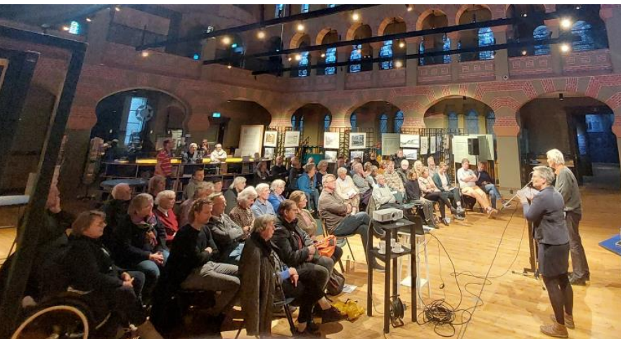
^ Synagoge Groningen als ontmoetingscentrum tijdens een symposium in samenwerking met Werkgroep Toegankelijk Groningen (2022).

Met onze ruime openstelling dragen we bij aan het levendige karakter van Groningen. Aansluitend op de beleidsstrategie Samenleven met Cultuur van Gemeente en Provincie Groningen, willen wij ons verhaal bereikbaar en toegankelijk maken voor iedereen. Juist vanwege onze maatschappelijke boodschap (zie 2.2 Huis van Burgerschapseducatie), willen we geen fysieke, financiële of morele drempels voor bezoekers opwerpen. Kunst en cultuur horen voor iedereen bereikbaar te zijn. Op verschillende momenten, bijvoorbeeld tijdens de Kristallnachtgedenking en de Europese Dag van het Joods Cultureel Erfgoed, stellen we de synagoge kosteloos open en met de Stadspas is een bezoek altijd voordelig. We ontwikkelen nieuwe programma's voor doelgroepen die een afstand ervaren tot culturele instellingen, zoals voor mensen met een visuele beperking of met een taalachterstand.