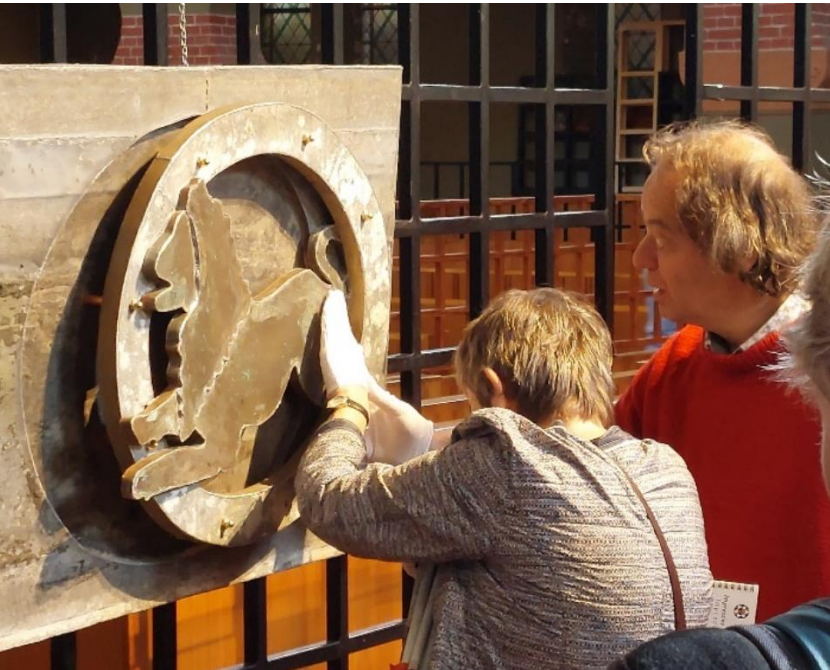
<Voel de Sjoel. Een educatief programma van Synagoge Groningen voor blinden en slechtzienden.

beleid te voeren, zetten we ons met onze partners in voor een mooiere samenleving. Zo zijn we lid van verschillende samenwerkingsverbanden en zijn aangesloten bij Erfgoedpartners. We steunen de kleinere Joodse erfgoedinstellingen in onze regio, door hen met raad en daad bij te staan. Bijvoorbeeld door een expositie-uitleen. Ook in deze samenwerkingsverbanden vormen eerlijke beloning en goede omgangsvormen kernwaarden.