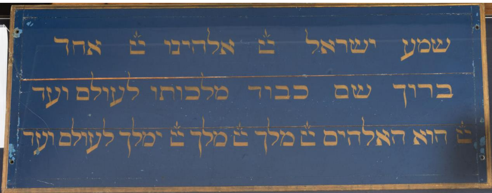
Gebedsbord afkomstig uit de in 1964 gesloopte synagoge van Stadskanaal. In 2021 geschonken aan Synagoge Groningen.

Zoals verwoord in onze ambitie, willen we in de komende beleidsperiode Synagoge Groningen ontwikkelen tot een museum dat is opgenomen in het landelijk museumregister. We delen het verhaal van de Joods-Groningse identiteit, door het unieke verhaal van een minderheidsgroep in onze provincie op een eigentijdse manier te tonen. Door te tonen hoe we als Groningers een divers en kleurrijk gezelschap vormen, sluiten we aan bij de beleidsstrategie Thuis in Groningen van de Provincie Groningen. Erfgoed is belangrijk bij de vorming en beleving van onze identiteit. Onze collectie toont dat Joden onderdeel waren én zijn van de Groningse samenleving. Met onze collectie, zowel materieel als immaterieel (oral history), versterken we onze identiteit als de locatie bij uitstek waar je als bezoeker kennis maakt met de Joods-Groningse cultuur. Overigens gaat die identiteit verder dan enkel onze collectie. In workshops, educatieprogramma's, lezingen (ook buiten Synagoge Groningen) en tijdens concerten benadrukken we de eigenheid van de Joodse cultuur in Groningen.